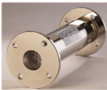
Der Original-Scale-Buster hat sich seit Jahrzehnten bewährt und wird jetzt von der ISB Watertec GmbH vertrieben.

Zusätzlich beugt der Kalkschutz nach dem Opferanodenprinzip auch aktiv Korrosion und Lochfraß vor. Das Opferanodenprinzip ist schon seit Jahrzehnten aus dem Schiffsbau bekannt. An den Außenwänden von Schiffen werden Zinkplatten angebracht, die statt der