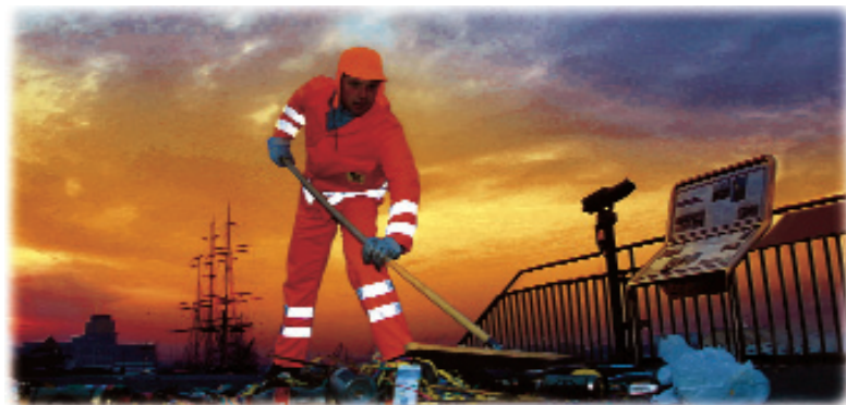
Trotz der malerischen Kulisse des Hamburger Hafens: Stadtreinigung ist ein 'schmutziges' Geschäft. Deshalb ist die anschließende Hygiene für die Mitarbeiter eminent wichtig.

Schiffshaut und der Antriebswelle korrodieren. Genauso schützt auch diese Lösung wasserführende Leitungssysteme: Statt der Rohrwand korrodiert gezielt die Zinkanode, die damit wie eine Sollbruchstelle wirkt. Dennoch enthärtet dieses System das Trinkwasser nicht. So bleiben für Geschmack und Gesundheit wertvolle Mineralien erhalten. Von den zugesetzten Zinkspuren geht keine Gefahr aus - im Gegenteil: Zink gilt als wichtiger Baustein für viele Enzyme.